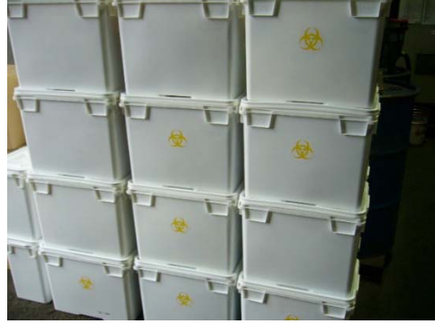
焼却炉へ投入される廃棄物