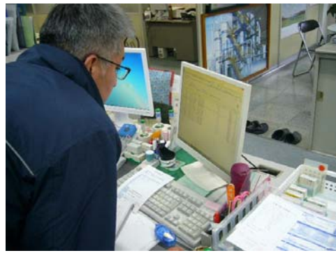
電子 manifests の確認