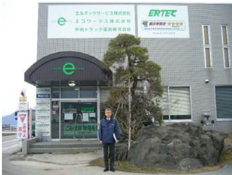
エルテックサービス本社前