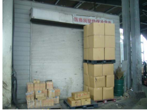
焼却前感染性廃棄物