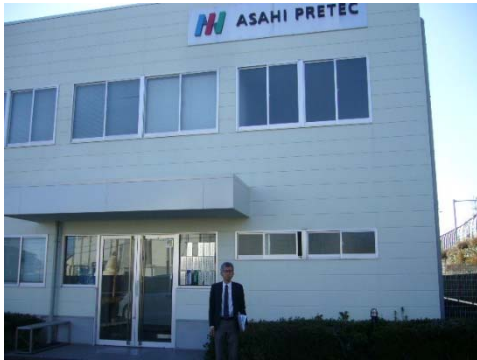
アサヒプリテック静岡営業所前