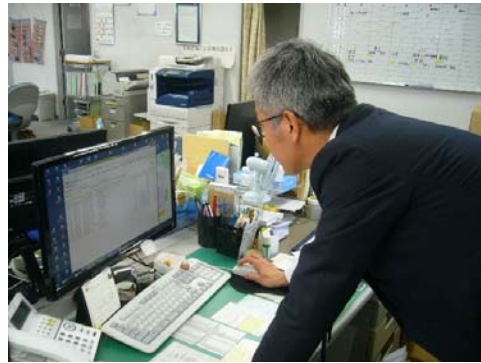
電子マニフェストの確認