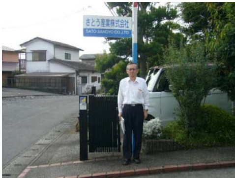
さとう産業本社前