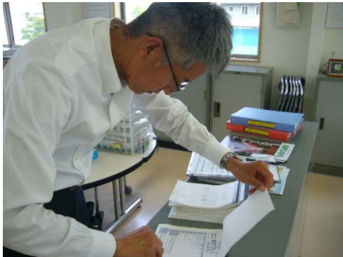
受渡確認票の確認