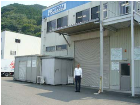
日本産業廃棄物処理本社前