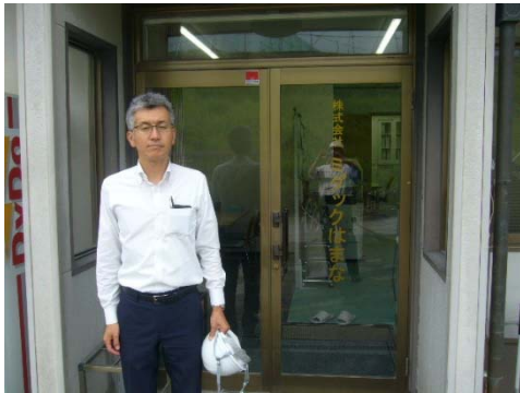
遠州クリーンセンター管理事務所前