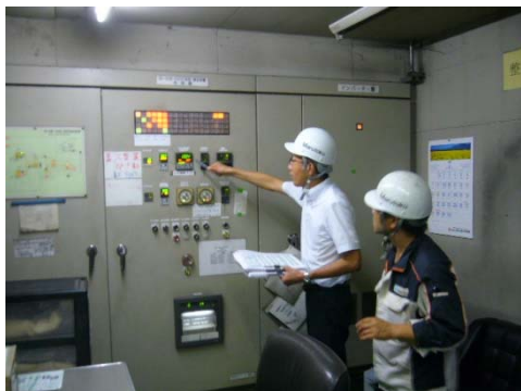
焼却炉のデータ確認