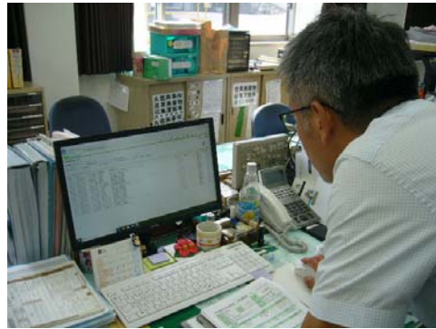
電子マニフェストの確認