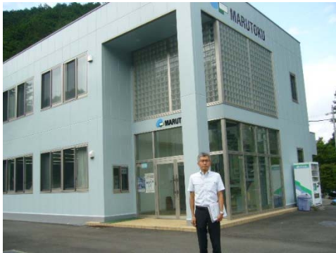
丸徳商事宍原事業所前